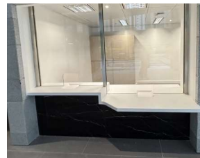
畅通易达公共询问或服务柜台