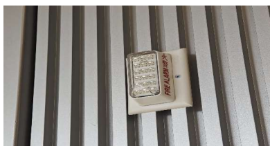
视像火警警报系统