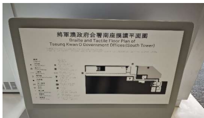
触觉点字及触觉平面地图