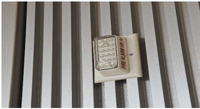
視像火警警報系統