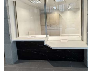
暢通易達公共詢問或服務櫃枱