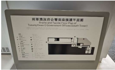
觸覺點字及觸覺平面地圖