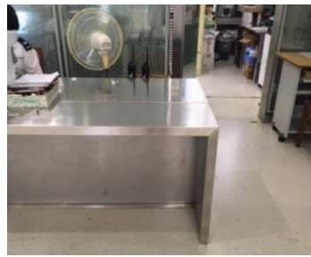
畅通易达公共询问或服务柜台