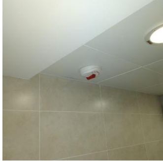
視像火警警報系統