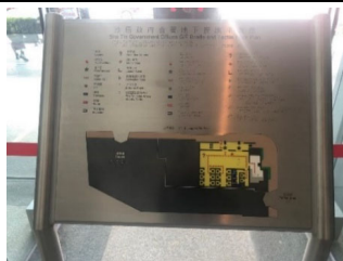
觸覺點字及觸覺平面地圖